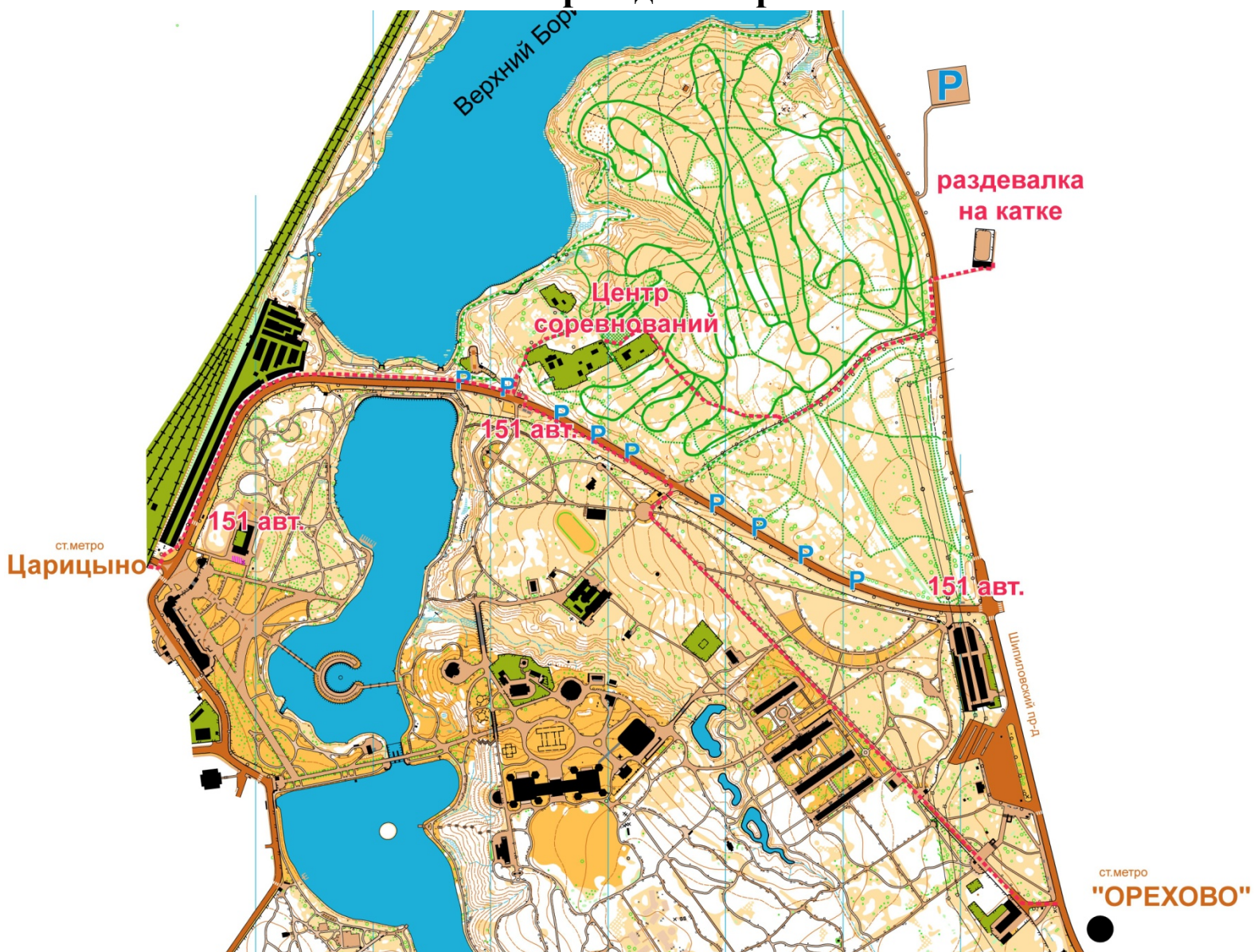
Схема трассы 1км